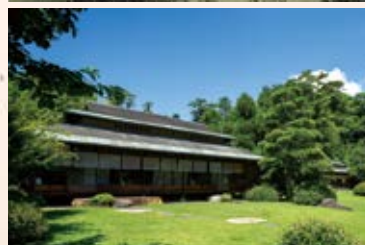
「松風」。庭園の姿は今も変わらない