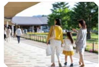
軽井沢・プリンスショッピングプラザ

特定期間(12月23日～1月3日)のうち、平日はまだ空室がございます。抽選に落選された方や申し込まれなかった方、当選が2泊分以下の方は特定期間でもホーム施設を3か月前からご予約いただけますので、ぜひご利用ください。なお、特定期間のご予約には「3泊制限」があり、それ以上のご宿泊の際は10日前からのご予約となります(ご利用案内2023年度 p.11ご参照)。